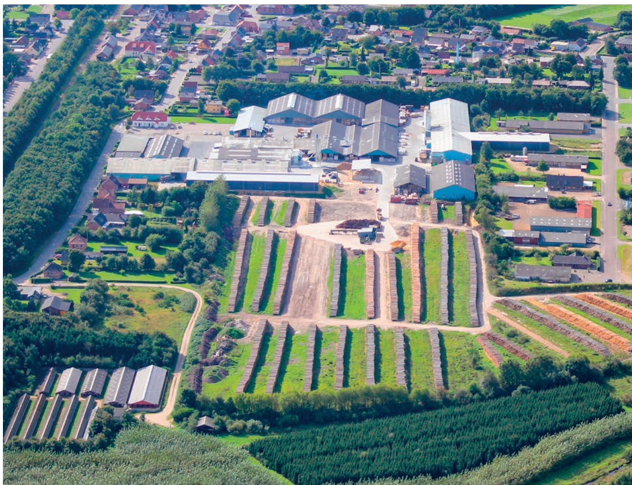
Fabriksmarken före utbyggnaden.

I samband med utbyggnaden av fabriken i Trolldhede har företaget valt att börja separera spillvatten och regnvatten. Det var något av ett detektivarbete att kartlägga det befintliga ledningssystemet, men i gengäld minskar belastningen på det lokala reningsverket och vattenmiljön.