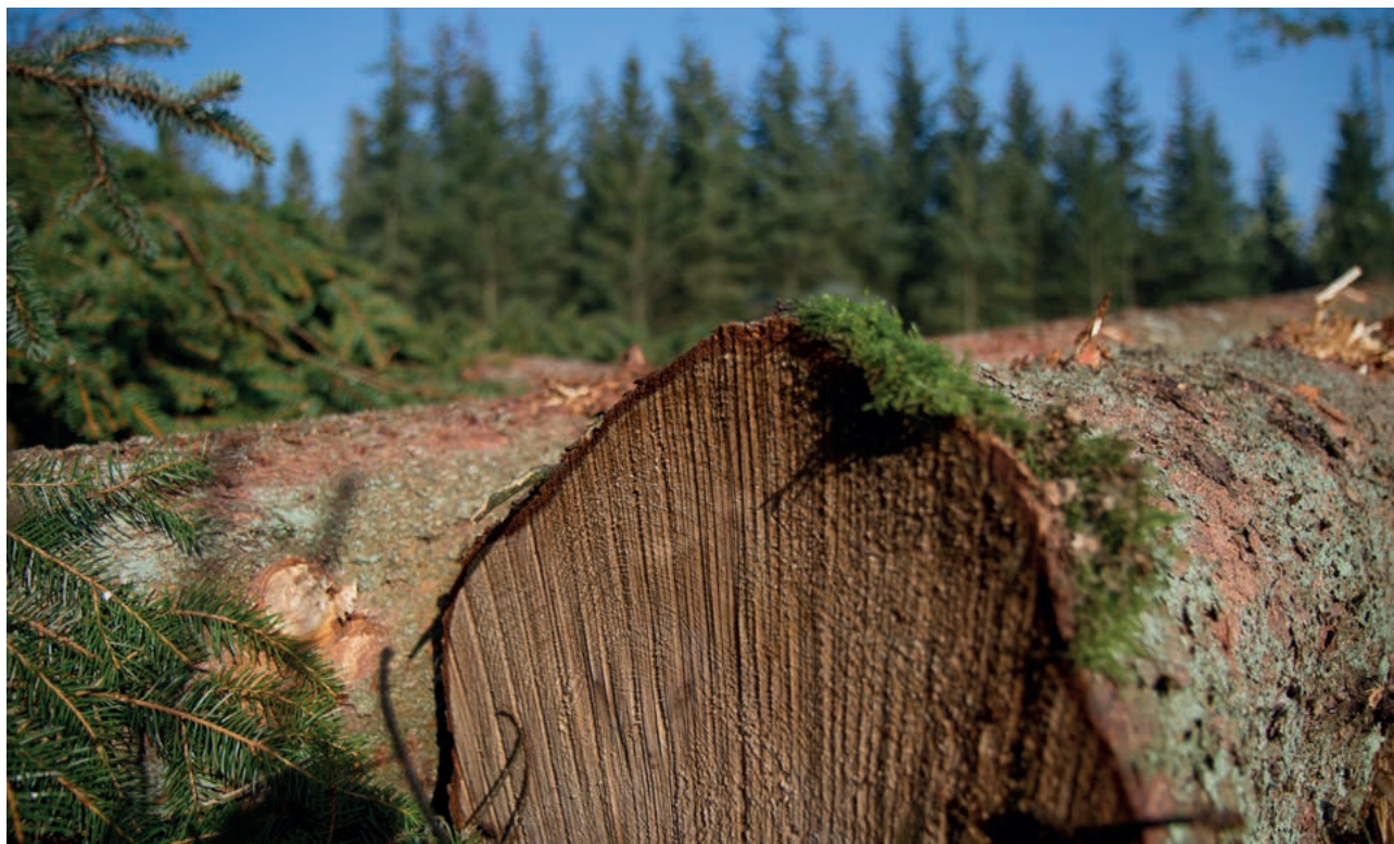
Från en av de hållbara skogar där träet till Trolldtekt-plattorna hämtas.